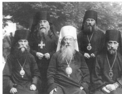
De gauche à droite, assis: archevêque Vladimir, métropolite Euloge, archevêque Alexandre, debout: évêque Serge, évêque Benjamin.

Статья 4 устава уточняла, что Бельгийская архиепископия «составляет неразрывную часть экзархата, установленного для православных русских церквей в Европе» и «подчинена духовной власти архиепископа-митрополита русских православных церквей в Европе, Экзарха Его Святейшества Вселенского Патриарха (ныне Его Высокопреосвященства Митрополита Евлогия Георгиевского) а через него духовной власти Его Святейшества Вселенского Константинопольского Патриарха» 33 . Так была официально создана в Бельгии первая православная епархия, в которую вошли приходы бывшего благочиния, а Свято-Никольский храм в Брюсселе стал кафедральным собором.