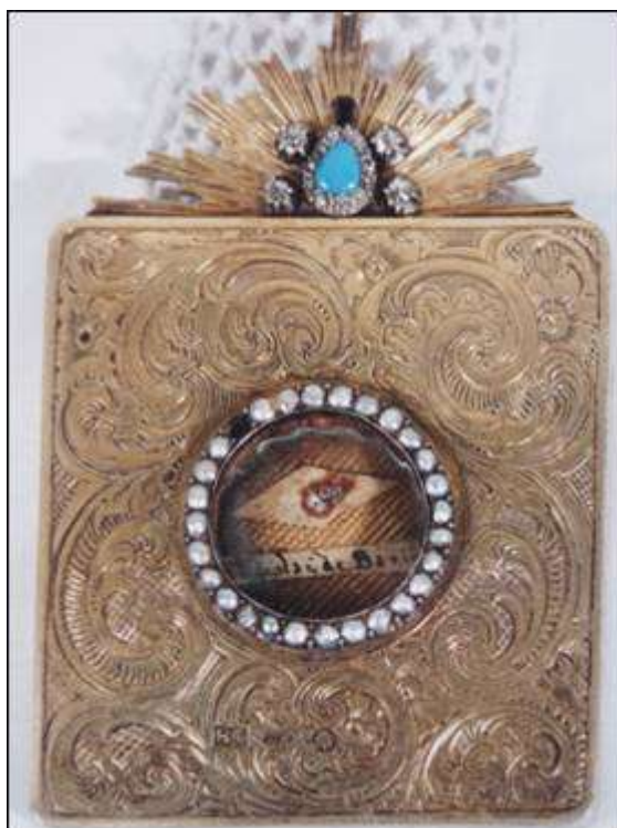
Ковчежец с частицей мощей св. Николая Чудотворца хранящийся в Свято-Никольском храме города Брюсселя.

История этого ковчежца весьма замечательна. В 1848 году граф Блудов был в Риме, где заключался конкордат между Российской Империей и Ватиканом. Там ему был подарен Папой римским этот ковчег с частицею мощей Святителя Николая, архиепископа Мир Ликийских. По возвращении в Петербург Блудов преподнес ковчежец Императору Николаю I, чьим небесным покровителем и был Святитель Николай. Этот ковчежец находился у Императора до последнего дня его жизни и был найден под подушкой усопшего.