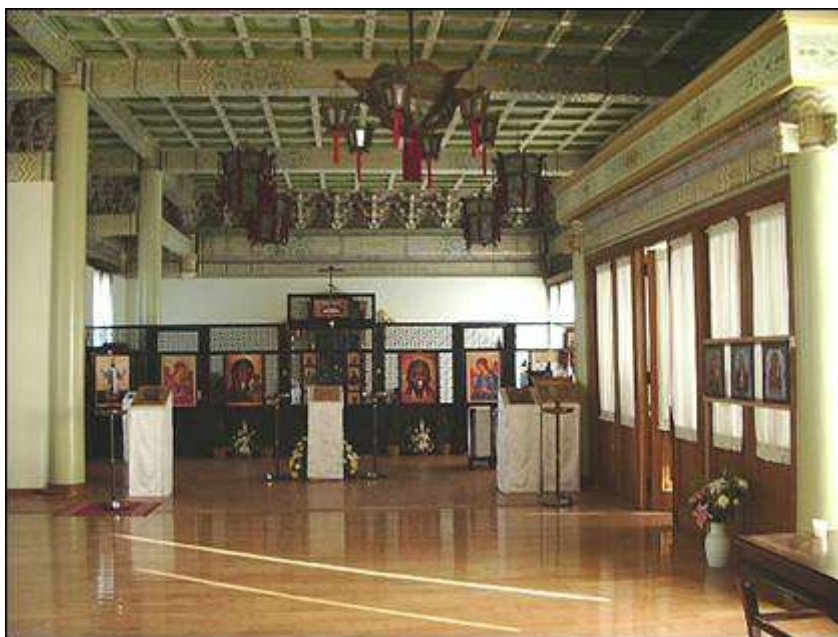
Современная русская церковь в честь Святителя Иннокентия

Пекин. Богослужения ведутся с 1990-х годов.