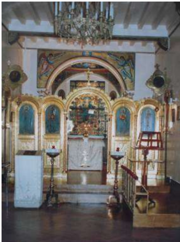
Храм Святителя Николая в Брюсселе. 1999 г.

Площадь домового Свято-Никольского храма в Брюсселе без алтаря составляет около пятидесяти квадратных метров. Площадь, занимаемая домом с садом, составляет 2,1 ара. При покупке дома церковь располагалась в трёх комнатах на первом этаже. В 1896 году на средства бывшего Турецкого Посланника в Бельгии Стефана Каратеодори был пристроен алтарь, покрытый куполом, сооружен иконостас и устроена солея.