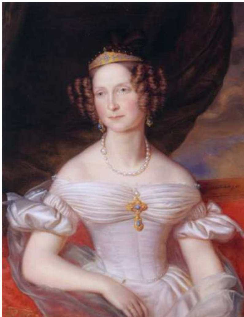
Анна Павловна, королева Нидерландов в 1840-1849 гг.

значится «шпелль русь», то есть русская часовня, расположенная в одном из жилых домов этого района города. Практика устраивать церковь на этаже жилого дома сохраняется в Брюсселе и поныне. Так сейчас устроены храмы Константинопольской, Русской, Сербской, Болгарской и Грузинской Церквей.