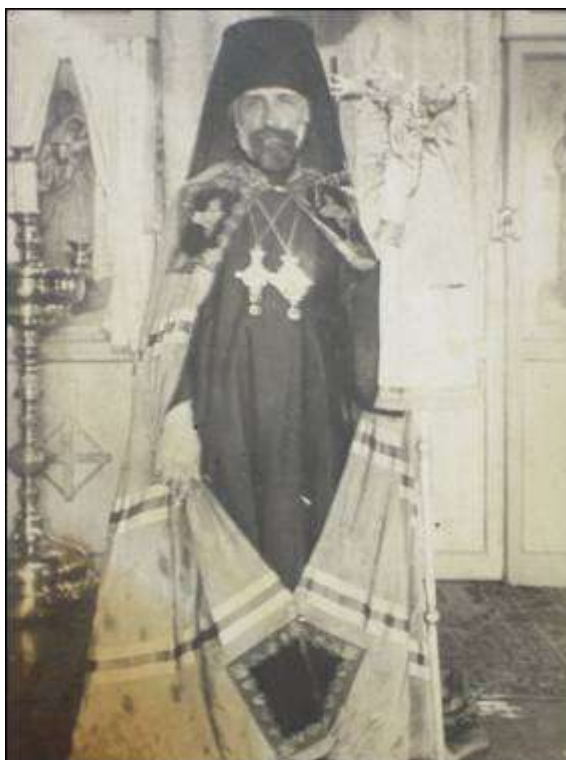
Епископ в последствии митрополит Александр (Немоловский) фоторафия публикуется впервые. АРЭ

Начав трудиться в Брюсселе с 5 января 1929 года, владыка Александр все свои силы и энергию отдавал прихожанам. Любовь к нему и уважение простиралась далеко за пределы его паствы. Несмотря на образовавшиеся разделения среди русской колонии в эти годы, личный авторитет владыки благодаря его любвеобильному сердцу, участию ко всем скорбящим и усердным молитвам, был весьма высок.