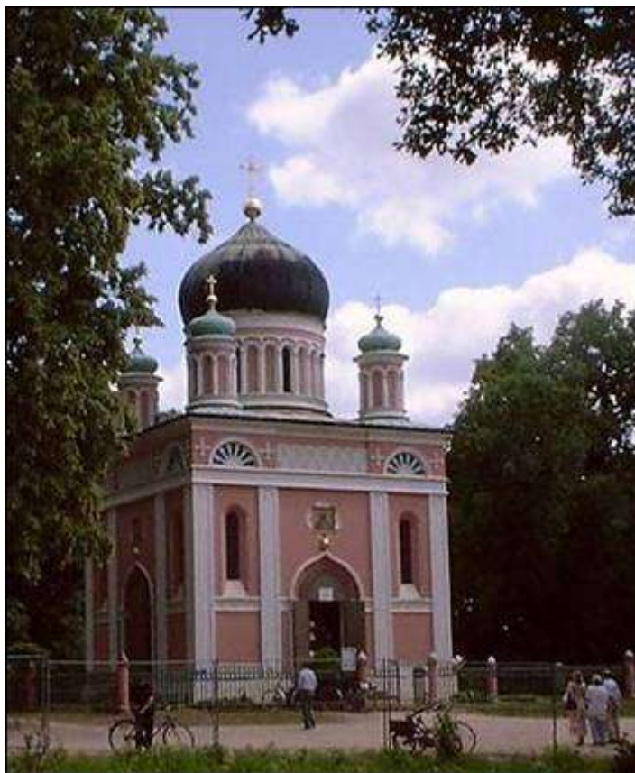
Русский храм святого благоверного князя Александра Невского в Потсдаме.

вышеуказанные часовни, не сохранилась. Следующая по времени русская церковь в Потсдаме была построена только в 1827 году.