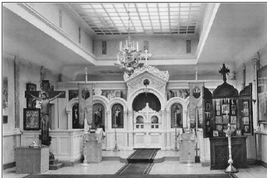
Русский Храм Преображения Господня в Стокгольме.

Архиепископу Новгородскому. Доныне этот район Стокгольма называется Русгарден (Russgården), то есть Русский Сад.