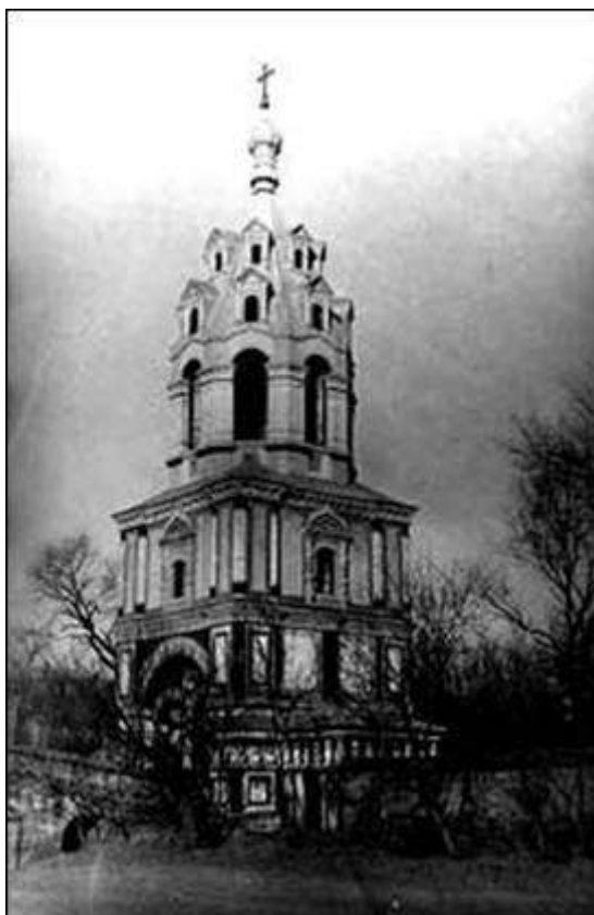
Святые ворота Русской Духовной Миссии в Пекине.