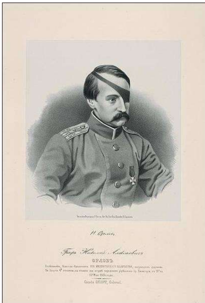
Полковник Николай Алексеевич Орлов.

Именно это и попытался сделать князь Орлов. Он арендовал для церкви в 1862 году большое новое здание, как писали современники, вмещавшее 100 человек, и закупил на свои средства новую утварь, посвятив храм своему небесному покровителю Святителю Николаю. Более того, он хотел открыть в штате Миссии оплачиваемую из Российской Империи должность священника. Здесь он столкнулся с бюрократическими трудностями. Формально по документам Духовной консистории священник в Брюсселе был, так как он назначался ко двору Анны Павловны. Князю Орлову необходимо было разъяснить Консистории и МИДу, что власть Нидерландской короны после бельгийской революции на Брюссель больше не распространяется и, следовательно, нет юридических оснований рассматривать придворного священника Анны Павловны как священника, назначенного в Бельгию.