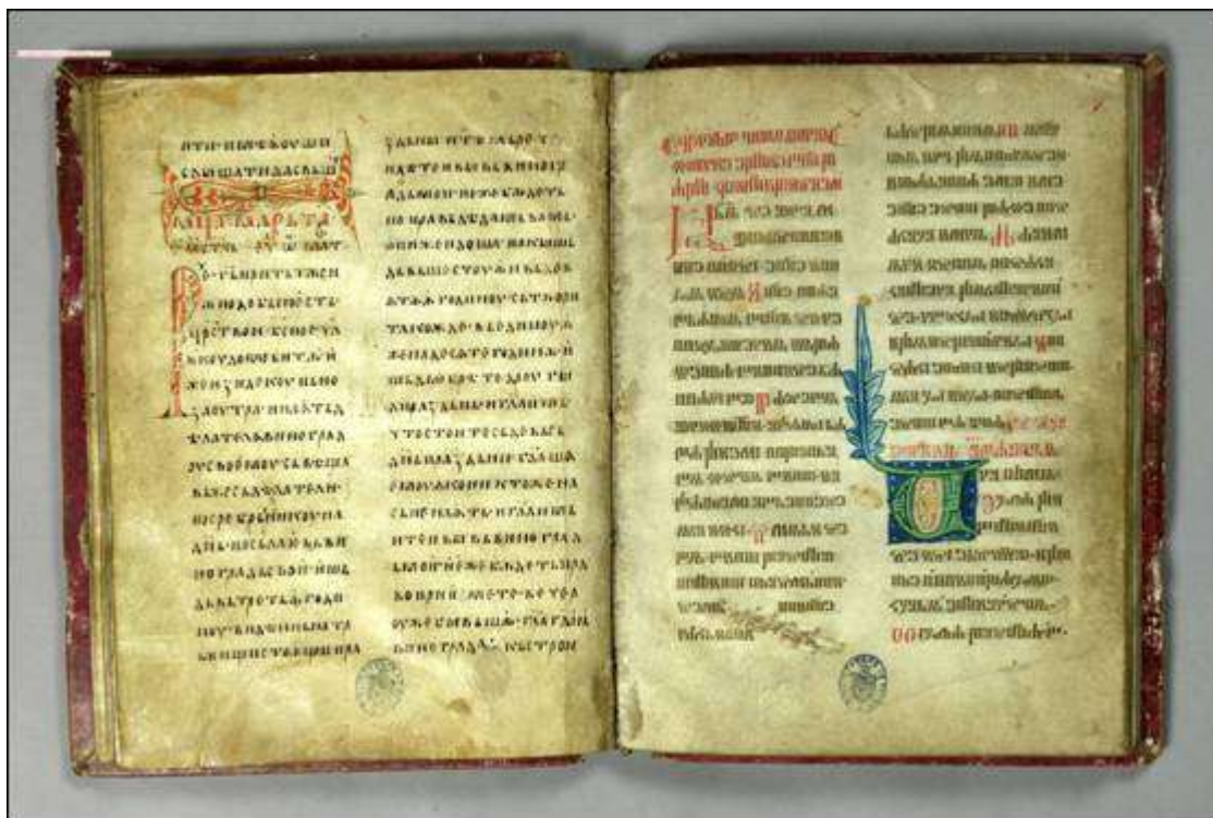
Реймское Евангелие «Священный Текст».

свою присягу на славянском евангелии их русской прабабки. До сих пор во Франции это только одна на всю страну и единственная книга, имеющая уникальное название «Текст Сакрэ» («Священный Текст»).