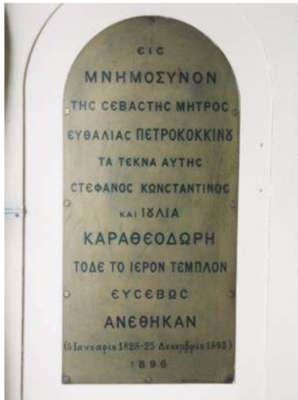
Памятная плита об устройении иконостаса Никольского храма. Фото 1999 г.

«Престол в ней (церкви) один, в честь и память Святителя Николая Чудотворца. Ризница и утварь в ней небогатая, но достаточная. Приписанных к сей церкви церквей нет, часовен и домов кладбищенских тоже нет. <...> Старосты тоже нет», - написано в «Ведомости за 1909 год». Пройдет чуть более десяти лет, и в Бельгии начнут появляться другие русские приходы, а настоятель Никольского храма получит титул «Благочинный по Бельгии и Голландии».