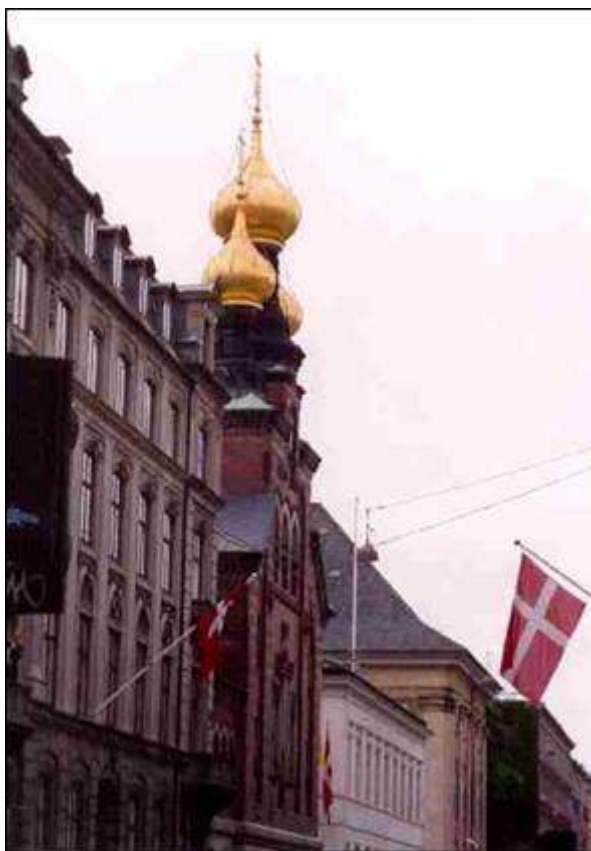
Русский храм св. блгв. князя Александра Невского в Копенгагене.

Первый русский храм в Копенгагене был основан во 2-ой половине ХУШ века в резиденции Российского Посланника при Датском Королевском Дворе. В другом небольшом датском городе Хорсенсе с 1780 по 1809 г. был домовый храм при резиденции принцессы Екатерины Антоновны Брауншвейг-Люнебургской.